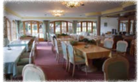
Speisesaal im Gruppenhaus in Telfes